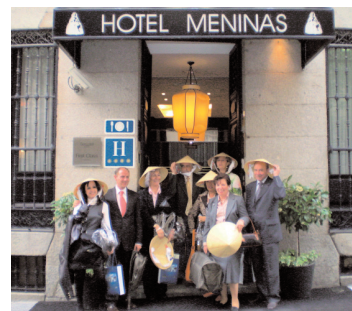
Presentación Viaje a Vietnam

Se ha señalado Fitur 2009, como punto de encuentro para seguir profundizando en una posible colaboración con nuestras Organizaciones.